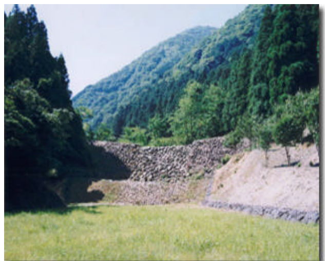
羽根谷砂防堰堤 (第一堰堤) (HPから)