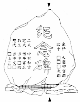
左 高倉谷タテナリ2号堰堤記念碑